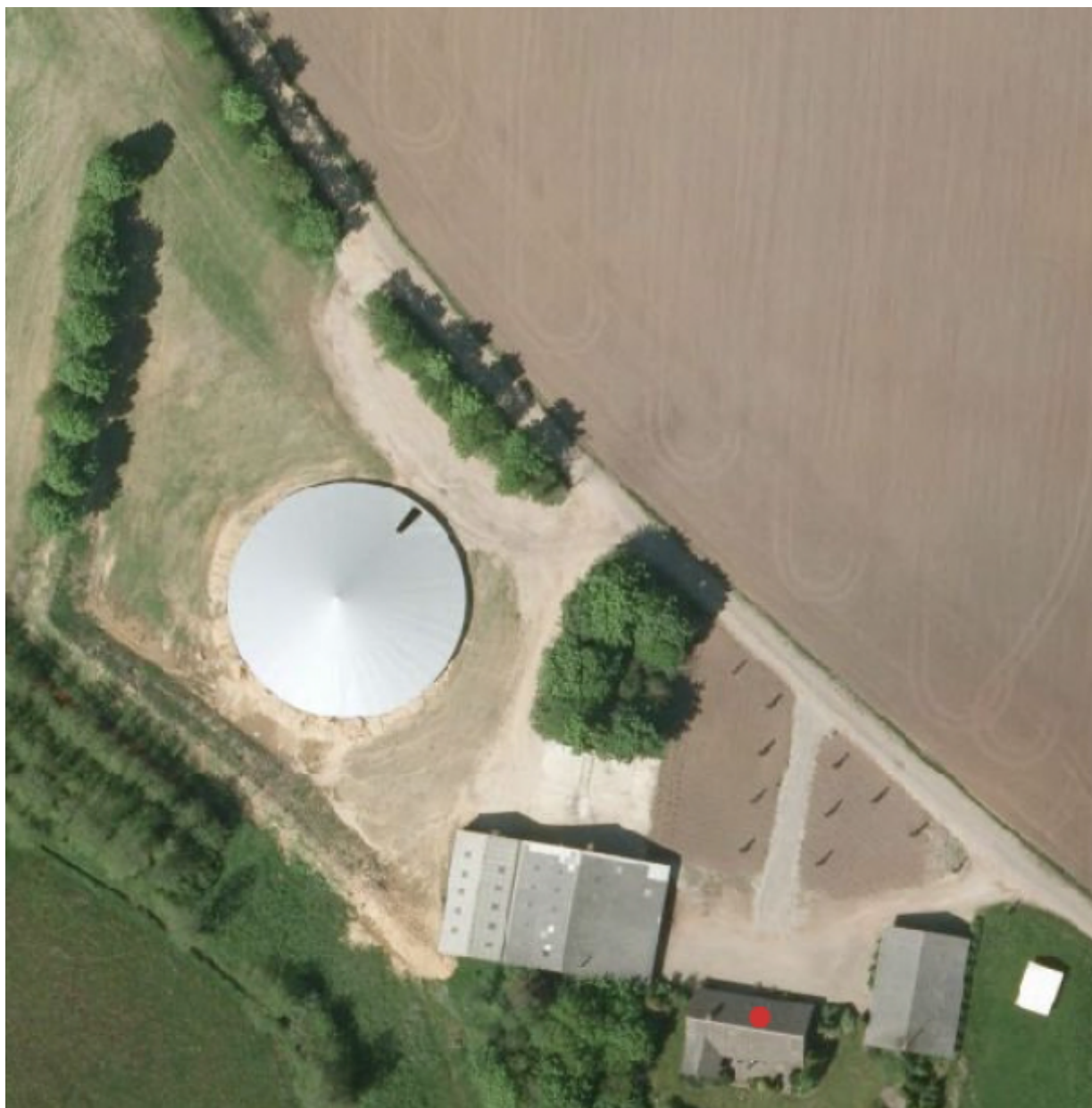
Figur 2. Gylletank nær Abildhedevej 10.

For at beskytte kommende ejer fra gener fra gylletanken, blev der stillet følgende vilkår i tillæg til miljøgodkendelsen.