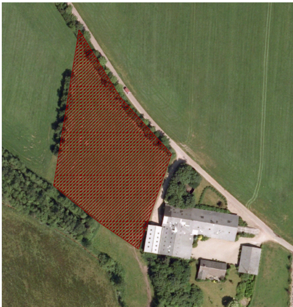
Figur 3. Rød skravering viser det areal, der skal overdrages til Abildhedevej 10.

I/S Vejgården har søgt om, at ovenstående vilkår slettes i tillæg til miljøgodkendelse dateret den 27. oktober 2011 med følgende begrundelse: